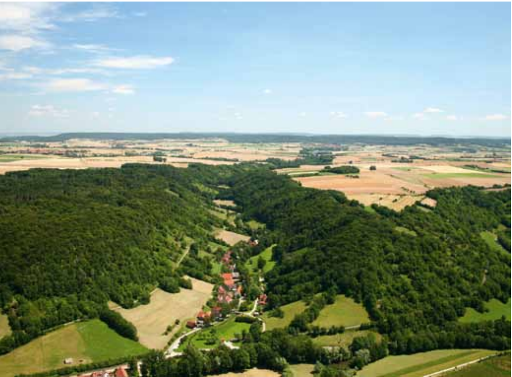
Das Steinbachtal nach Osten

Muschelkalks erreicht und ein breiteres, geknicktes Talprofil ausbildet. Spuren des historischen Weinbaus finden wir unterhalb Rothenburgs überall – waagrechte Terrassenmauern und „Kormauern“, d. h. senkrecht zum Hang verlaufende, langgezogene Haufen von Lesesteinen, die man über Jahrhunderte mühselig und zäh aus den Weinbergen entfernt und an deren Rand abgelagert hat. Die aufgelassenen Weinberge sind inzwischen vielfach vom Wald bedeckt oder stark verbuscht. Viele Flächen werden jedoch glücklicherweise noch genutzt, gemäht oder von Schafen beweidet. So haben sich ähnlich wie an der Keuperstufe Landschaftsszenarien erhalten, wo der Naturfreund verschiedene Orchideen- oder Enzianarten antrifft, auf offenen Stellen gelegentlich den Wacholder. Besonders an den Lesesteinriegeln haben sich außerordentliche Biotope ausgebildet. Spaziergänge im Steinbachtal sollten zum Pflichtprogramm des Rothenburgers gehören: Im Frühjahr besonders, wenn Schlehenhecken weiß blühen, und im Altweibersommer, wenn die Landschaft in mediterraner Farbigkeit strahlt. Man lege sich ins Gras (oder setze sich auf eine Bank), schließe die Augen, träume ein wenig im Sonnenschein – und man erwacht in Umbrien oder in der Provence.