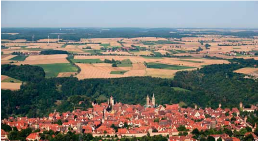
Rothenburg von Osten mit Blick auf die Hohenloher Ebene

mit seinen weiträumigen, reliefarmen Verebnungen und den charakteristischen westlichen Schauseiten von Steigerwald, Frankenhöhe oder Jura entstehen. Das geomorphologisch junge Tal der Tauber mit oft kurzen, aber tief eingeschnittenen Zuflüssen (Vorbach bei Niederstetten, Münstertal, Steinach, Gollach) ergänzt als Ausrufezeichen setzende Komponente das Erscheinungsbild unserer Landschaft. Erst gegen Ende des Tertiärs vor rund 5 Millionen Jahren, im Pliozän, kam es zum Kampf der Urdonau mit dem schließlich erfolgreichen Rhein.