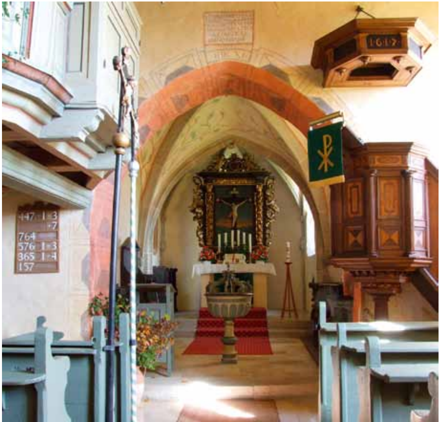
Kirnberg, St. Maria, Blick zum Chor

Mensa, Bild des Gekreuzigten gefasst von einem barockem Säulenrahmen mit zeitgenössischer Bekrönung, gelegentlich spätgotische Heiligenfiguren oder Predellen integrierend. Die „Kirchenlandschaft“ der Landwehr ist keineswegs monoton, aber