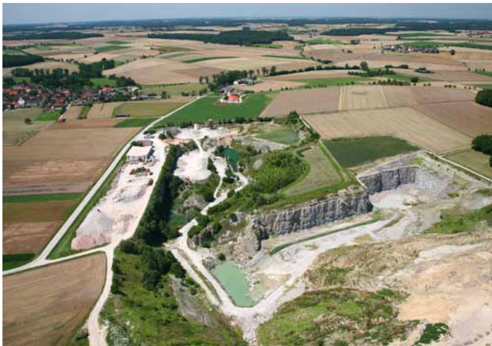
Der Steinbruch von Bettenfeld

Gelbe schattiert. Den „bunten“ Keuper, aufgeschlossen in Mergelgruben, Steinbrüchen oder Straßendurchstichen, sollte man mit seiner Farbskala nicht übersehen. Manche Schichten verwittern gerade an den Steilhängen zu flachgründigen, trockenen Böden. Hier war der Ackerbau schon immer ärmlich, und so haben sich im Lauf der Zeit zahlreiche Hutwasen mit einer Wärme und Trockenheit liebenden Flora und Fauna entwickelt, die man eigentlich viel weiter im Süden oder Südosten Europas erwartet. Solche Trockenrasengesellschaften mit Wacholderbüschen und Weißdorn-Schlehengestrüpp sind ein wertvoller, schützenswerter Naturraum, der durch die Beweidung mit Schafherden offen gehalten und gegen die drohende Verbuschung geschützt werden muss.