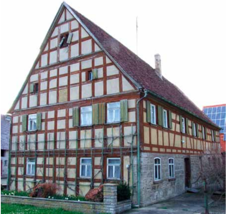
Oberscheckenbach, Haus von 1803. Inschrift an der Giebelseite: „Joh. Georg Decker mit seiner Frau Maria Barbara eine geborni Geyßendörferi haben das Haus 1803 nei gebaut hat das mal Korn kost 20 g das mal kern 22 gulden“

das Fehlen von Kontakten und Austausch mit den Nachbargebieten verstehen darf, sondern die Dominanz der Stadt in ihrem Herrschaftsgebiet, hat zur Ausbildung einer individuellen Kultur- und Kunstlandschaft geführt, die den Namen „Landwehr“ zu Recht führt und selbstbewusst führen sollte.